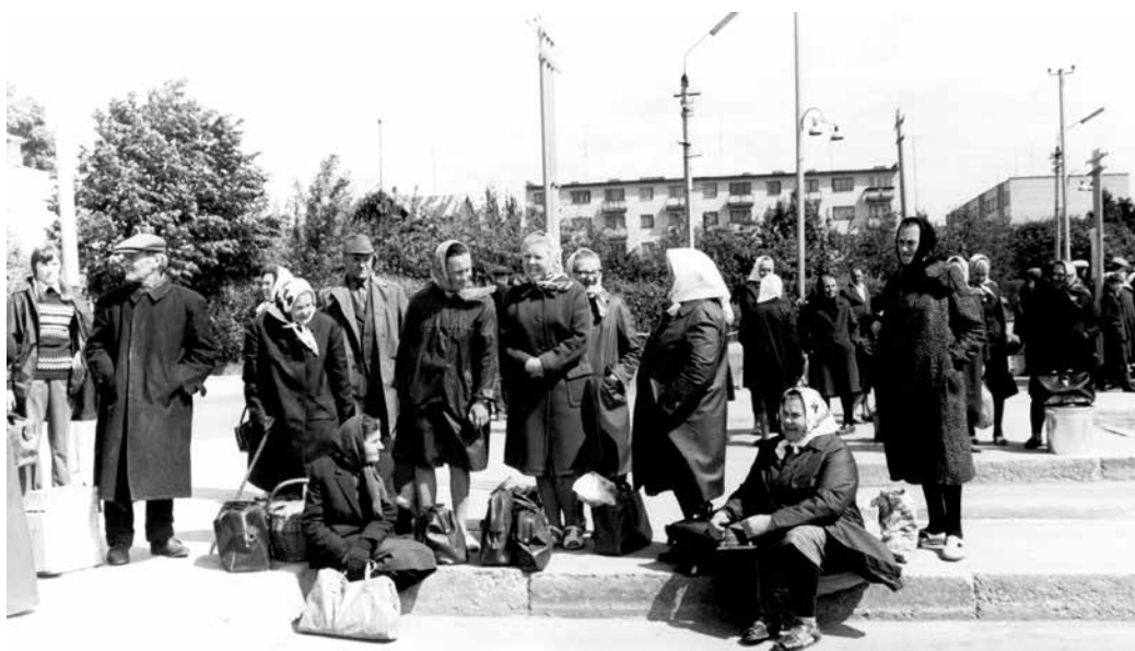
3 pav. Pasvalys, autobusų stotis. 1975 m. Išspausdinta „Šluotoje“ 1975 m.