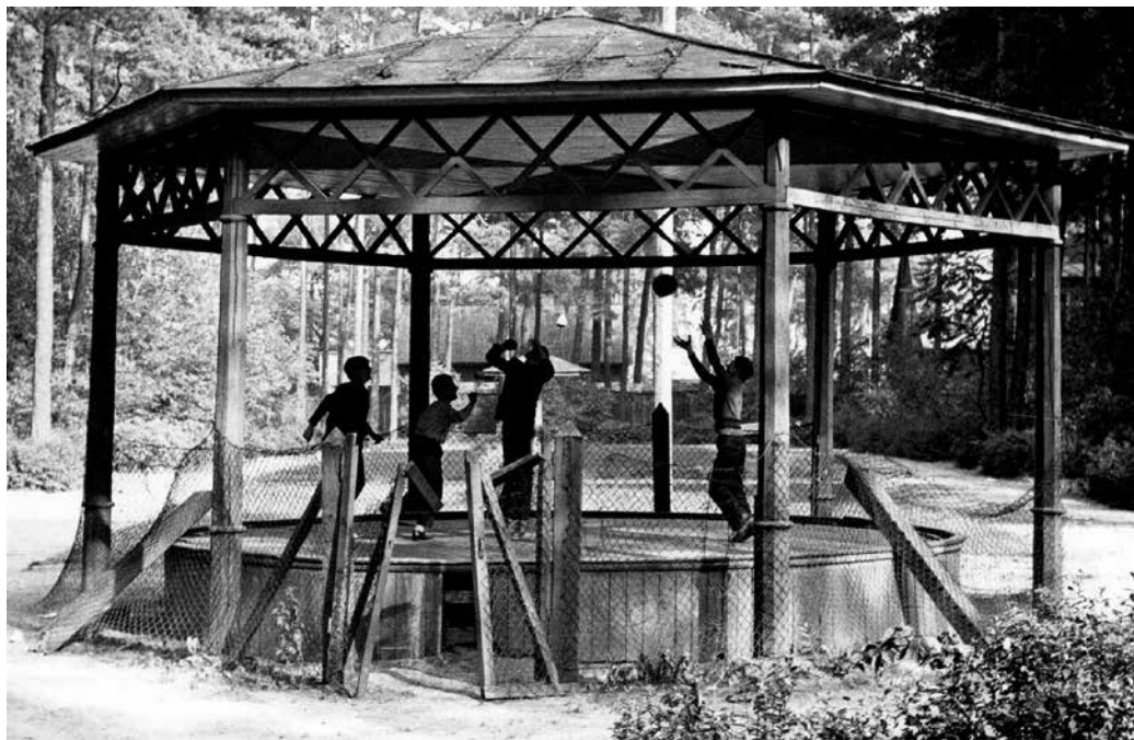
1 pav. Žaidžiantys vaikai sulūžusioje karuselėje Alytaus miesto parke. Išspausdinta „Šluotoje“ 1975 m. Nuotraukos originalas saugomas LLMA 1975, F 361, ap. 2, b. 306, l. 127

Netvarka viešojoje erdvėje kėlė nesaugumą, kurį laiškų autoriai siejo su įvairiais, net mirtiniais pavojais. Viename laiške Kauno rajono Babtų gyventojas rašo, jog dėl nesutaisyto kelio žuvo jaunas motociklininkas (LLMA 1975, F 361, ap. 2, b. 301, l. 13–14); kitame laiške pasakojama, kaip dėl duobės kelyje žmonės padarė avariją, keleiviui buvo sulaužyti šonkauliai ir sutrenkta galva; autobusas įvažia-