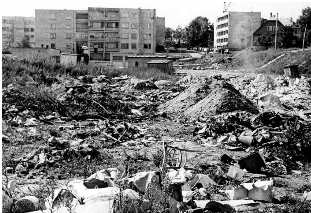
2 pav. „Iš tolo „šviečia“ būsiamasis Trakų stadionas...“, 1982 m. Neišspausdinta „Šluotoje“ Trakų gyventojų atsiųsta nuotrauka (LLMA 1982, F 361, ap. 2, b. 628, l. 9)

vęs į griovį išmušė vienai moteriai dantis, sutrenkė keleivius, kitas autobusas įkrito į griovį šalia kelio (LLMA 1975, F 361, ap. 2, b. 303, l. 155–156). Kiti skundėsi dėl neapšviestų gatvių ir viename laiške priminė, kad čia neseniai įvyko dar vis neišaiškinta žmogžudystė (LLMA 1980, F 361, ap. 2, b. 542, l. 107).